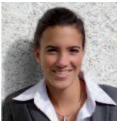
von Mag. a Birgit Koch Merkur Treuhand Steuerberatung GmbH www.merkurtreuhand.at